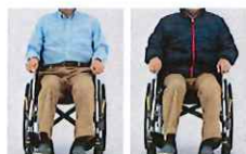
▲シート幅の調整で体形の変化や着こみにも対応します。