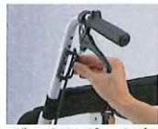
バックサポート高 簡単調整

インナーシートを通すパーツの高さをかえるだけで、簡単にバックサポート高を調整できます。(3段階、2cmピッチ)