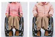
▲シート幅の調整で体形の変化や着こみにも対応します。